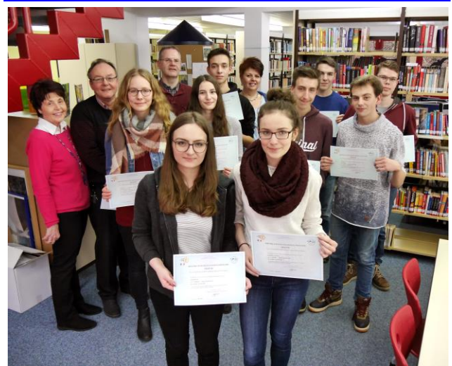
Verleihung der im Sommer bestandenen Diplome am 20. Dezember 2017